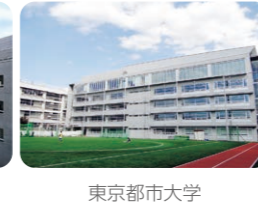
東京都市大学 等々力中学校・高等学校