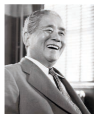
五島育英会創立者 五島 慶太先生