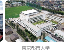
東京都市大学 塩尻高等学校