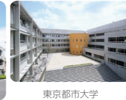
東京都市大学 附属中学校・高等学校