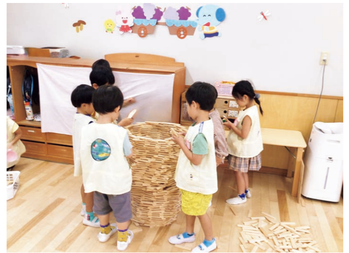
『カプラ (積み木)』あそび

自分の好きなあそびを見つけ、あそぶ面白さを存分に味わいます。 友だちと協力したり、競い合ったり、笑い合ったりする中で 人とのコミュニケーションを学びます。 「そういうやり方もあるんだ!」「明日もあそびの続きをしよう!」と 満足するまで好きなあそびをすることで集中力を身に付け、 自己表現する喜びを味わいます。