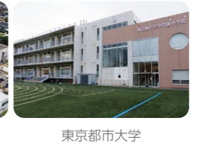
東京都市大学 附属小学校