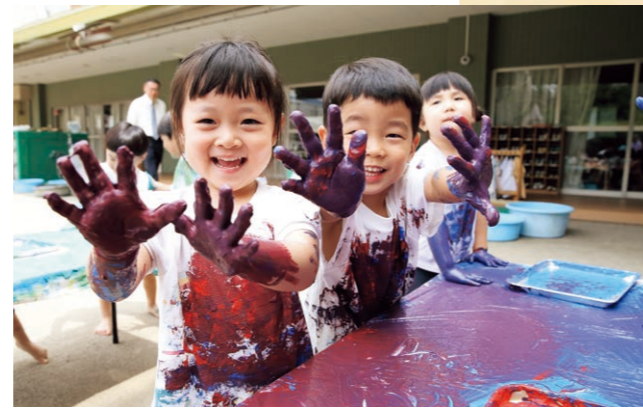
フィンガーペイント

子どもの年齢や発達に応じて計画した活動をあそびの中に取り入れています。 「初めてやってみたら楽しかった!」「こんな風にしてみたらうまくできた!」と 新しい発見をしながら興味・関心の幅を広げ、知的好奇心を育みます。 みんなと一緒に体験する中で“集団の中の一人である”ことを認識し、幼児期に おける社会性の土台を養っていきます。