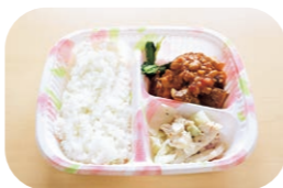
オーガニック給食

月曜日と火曜日はオーガニック食材を使った給食（外部委託）を実施しています。木曜日と金曜日をご家庭にてお弁当をご用意ください。給食とお弁当の両方を取り入れ、友だちと一緒に食事をする中で、様々な食材や味つけを味わい、好き嫌いをなく楽しく食べられるようにと考えています。