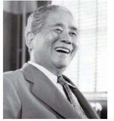
五島育英会創立者 五島 慶太先生