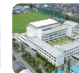
東京都市大学 塩尻高等学校