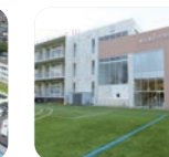
東京都市大学 付属小学校