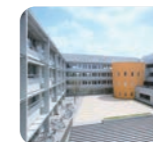
東京都市大学 付属中学校・高等学校