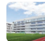
東京都市大学 等々力中学校・高等学校